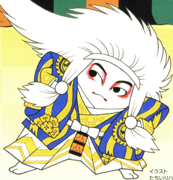
イラスト たちいりハルコ

主催=独立行政法人日本芸術文化振興会 共催=東京都教育委員会 後援=文化庁/埼玉県教育委員会/千葉県教育委員会/神奈川県教育委員会/ 東京私立初等学校協会/一般財団法人東京私立中学高等学校協会