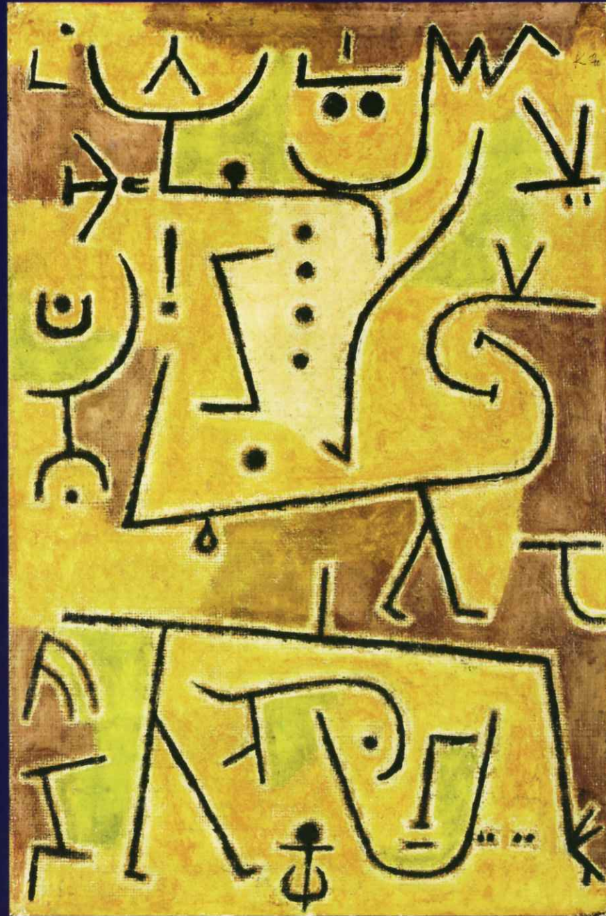
パウル・クレイ 赤いチョッキ 1938年、板に貼った麻布に糊絵の具 65x42.5cm ノルトライン=ヴェストファーレン州立絵画収集館(K20)、デュッセルドルフ

主催：特定非営利活動法人オペラ彩 共催：公益財団法人和光市文化振興公社 協賛：埼玉県芸術文化祭2024協賛事業 助成：公益財団法人三菱UFJ信託芸術文化財団