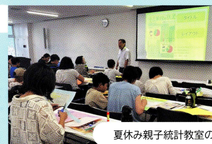
夏休み親子統計教室の様子