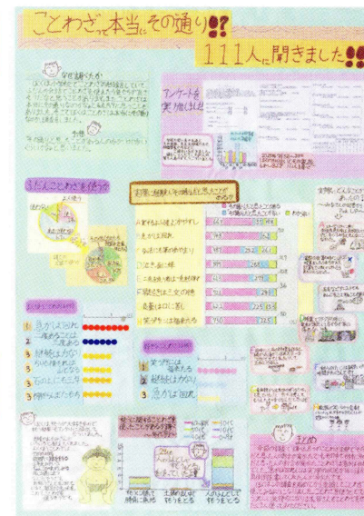
埼玉県知事賞 第2部(小学3・4年生の手描きの部)