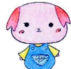
白子小キャラクター 「しらりん」